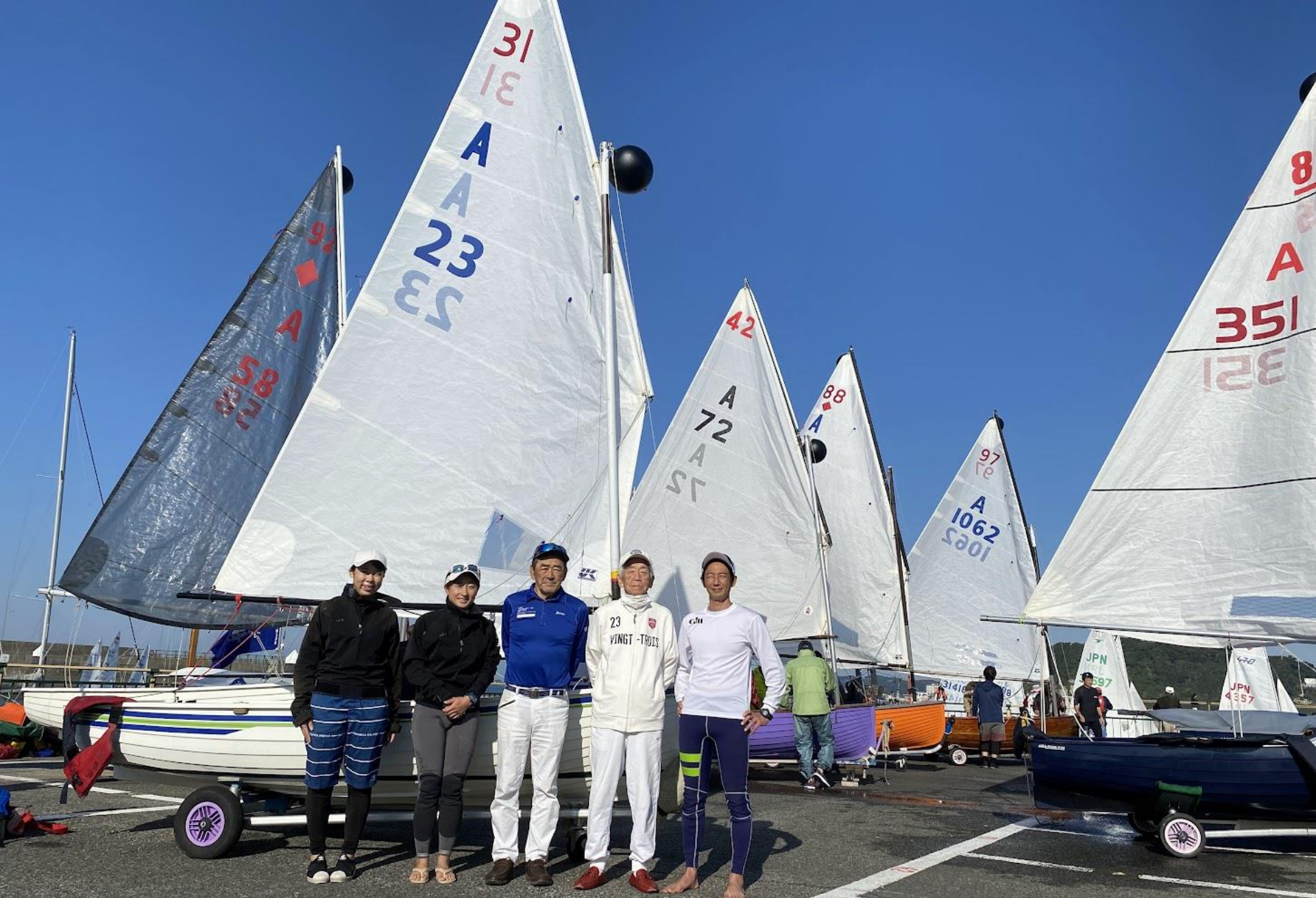
関西法友A級愛好会