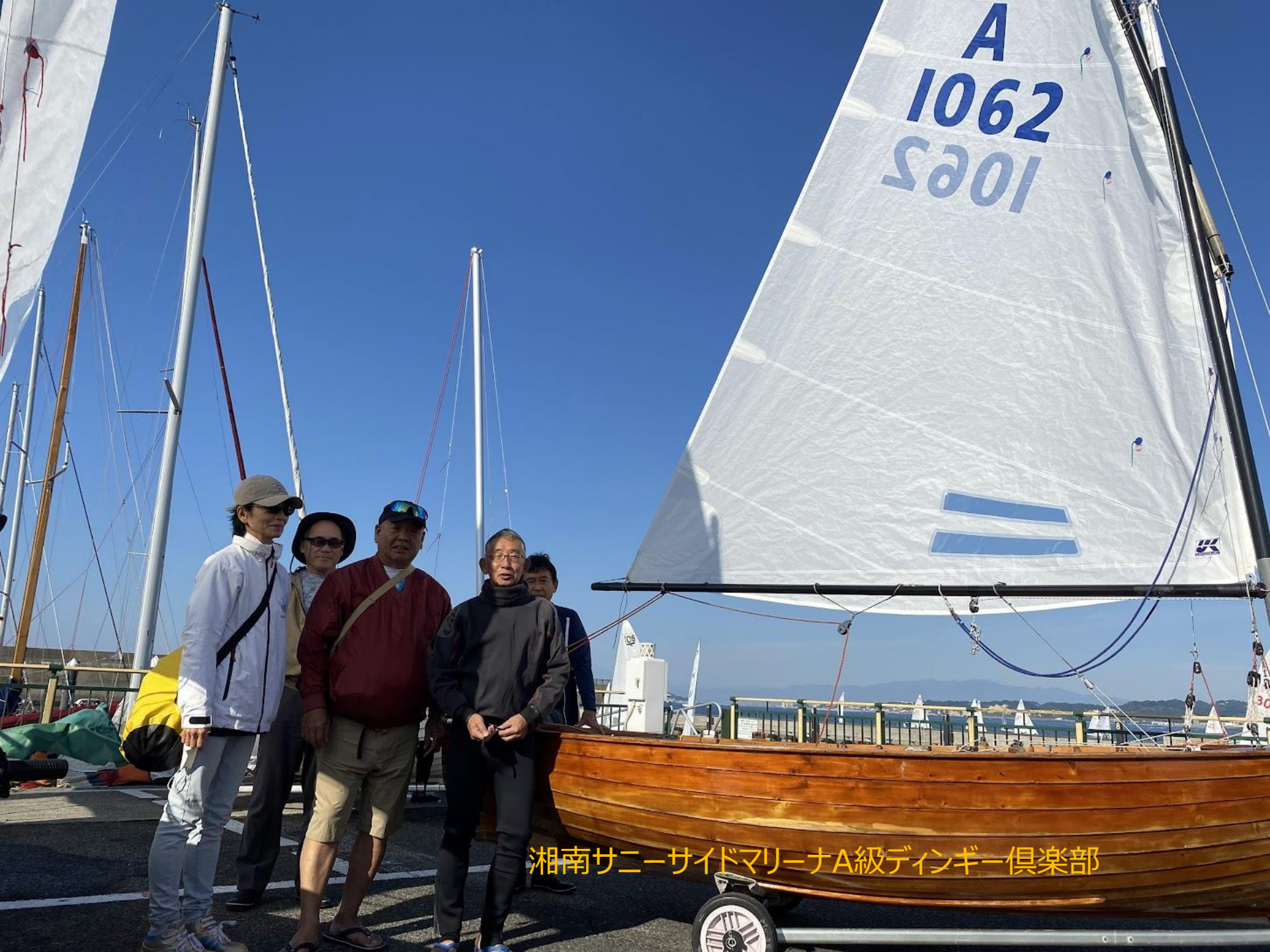
湘南サニーサイドマリーナA級ディンギー倶楽部