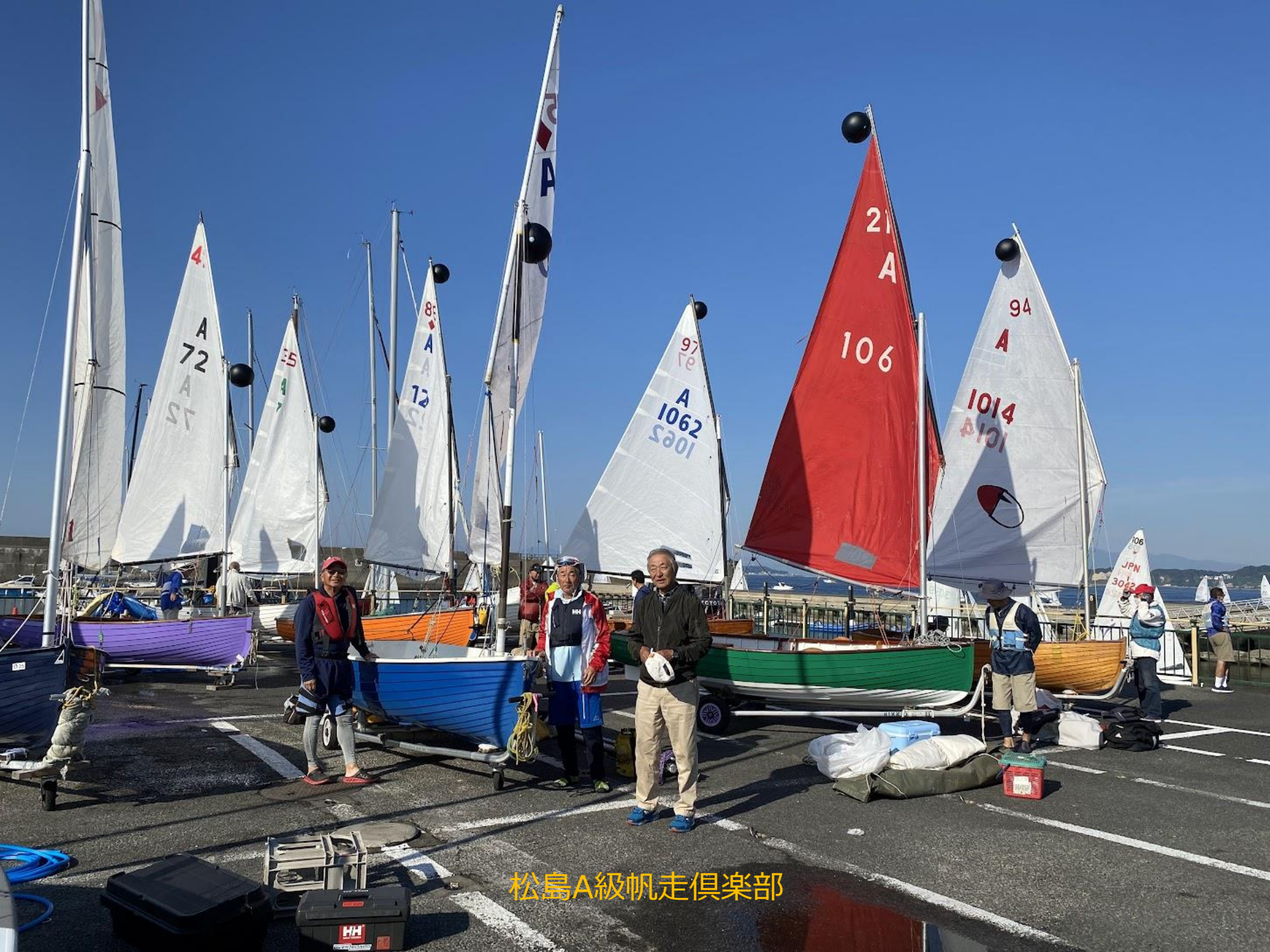
松島A級帆走倶楽部