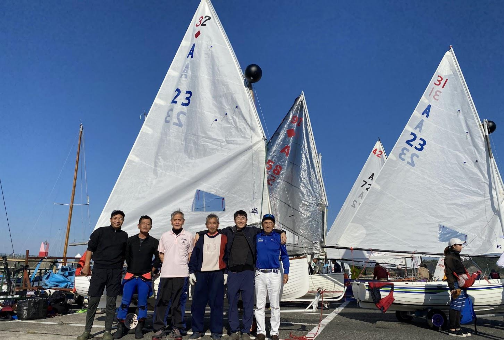
熱海高校すたーぼ倶楽部