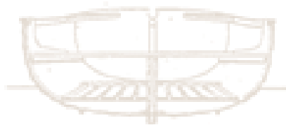
Struttura interna di Placca