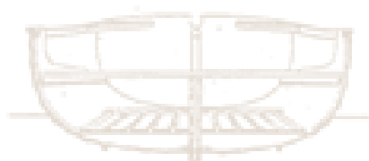
2000 Portofino 4.20m/13ft 9in