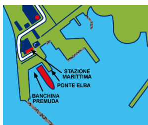
Porto di Piombino

Seguire le indicazioni per “Piombino/Isola d' Elba” e successivamente “Porto”. Prima di presentarsi all' imbarco ritirare i biglietti presso la Biglietteria della STAZIONE MARITTIMA sul Porto di Piombino dove saranno consegnate anche delle Istruzioni aggiuntive con il percorso da seguire ed i vari punti di ritrovo di Marciana Marina.