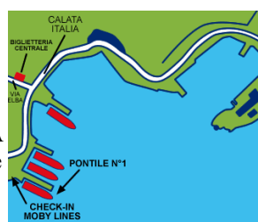
Porto di Portoferraio

Seguire le indicazioni per “Piombino/Isola d' Elba” e successivamente “Porto”. Prima di presentarsi all' imbarco ritirare i biglietti presso la Biglietteria della STAZIONE MARITTIMA sul Porto di Piombino dove saranno consegnate anche delle Istruzioni aggiuntive con il percorso da seguire ed i vari punti di ritrovo di Marciana Marina.